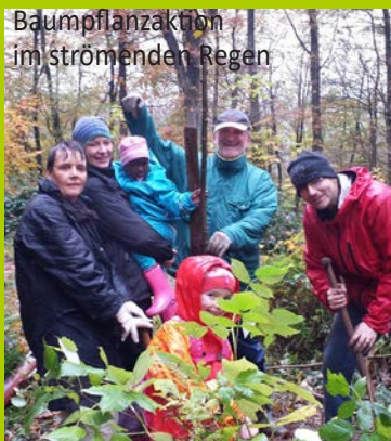
Baumpflanzaktion im strömenden Regen