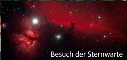
Besuch der Sternwarte